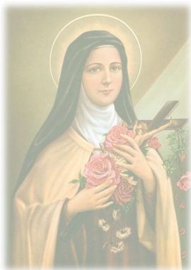
- Theresia van Lisieux -